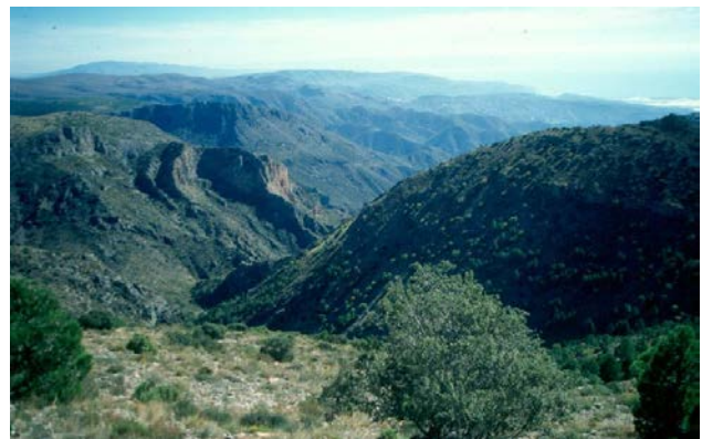
Ruta Enix-Almería PR-A 120

responsables de su gran riqueza mineral, sobre todo en plomo, azufre y zinc. Carece de cursos de aguas permanentes aunque, por su estructura geológica, actúa como una enorme esponja que nutre al complejo sistema de acuíferos del Poniente Almeriense, aflorando también a través de sus múltiples fuentes y nacimientos, y contribuyendo a la alimentación de la cuenca del Andarax.